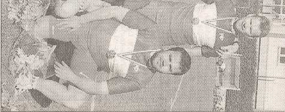
Les joueurs du VC Fritieuse-Sauviesse et France

Vainqueurs de Saint-Pierre Havrais ont remporté Le prochain, c'est pour