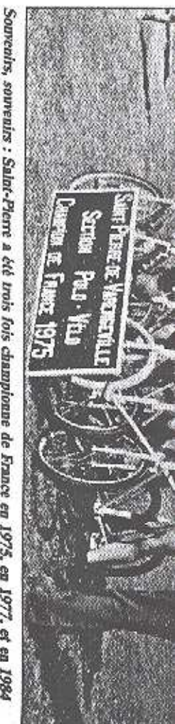
Souvenirs, souvenirs : Saint-Pierre a été trois fois championne de France en 1975, en 1977, et en 1984